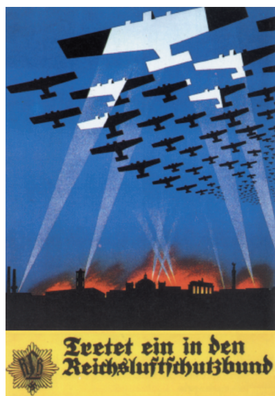
Plakaten opfordrer til at man bliver medlem af luftbeskyttelsesforbundet.

biografer og teatre blev lukket eller udbombet i 1944. Kun nogle få danserestaurantter forblev åbne af hensyn til orlovssoldaterne. Berlin blev fyldt med sårede soldater, der kunne fortælle forfærdelige historier om den brutale krigsførelse på alle fronter. Krigen var tabt, det vidste alle, men ingen turde tænke tanken til ende. Nazisterne strammede grebet om befolkningen, ingen turde udtale sig om krigens gang, fordi de frygtede Gestapos og SS'ernes brutale afregning. Enhver, der kunne opfattes som defaitist eller overløber, blev omgående dømt til døden ved de hurtigt arbejdende og mobile standretter; det gjaldt også kvinder. Omkring seks tusin-