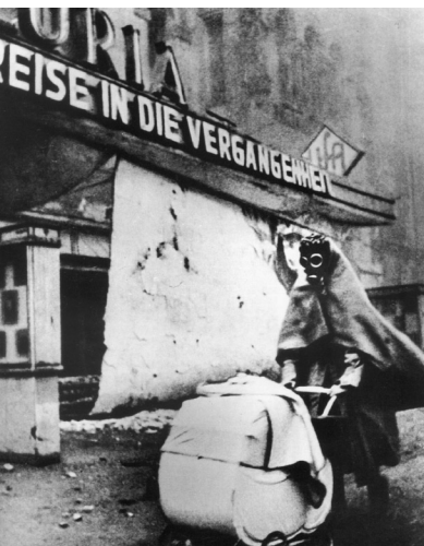
En kvinde flygter med barnevogn under et bombeangreb i marts 1945. Hun passerer en UFA-biograf, hvor den sidste film, der blev vist hed: "Rejse i fortiden".

igen efter, at angrebet var blevet afblæst, kunne de dårligt trække vejret af mangel på ilt og røg. De havde svært ved at se om det var dag eller nat. De skyndte sig tilbage til deres adresse for at konstatere, om bygningen stadigvæk stod der, og hvis ikke, så for at finde de få ejendele, som de kunne få fat i. Dræbte og sårede flød i gaderne, og det kunne ofte være vanskeligt at identificere ofre på andet end en vilsesring, et tandsæt eller en tøjstump. Men berlinerne fortsatte deres "normale" liv med de rutiner, som de nu engang havde, for ikke at blive vanvittige.